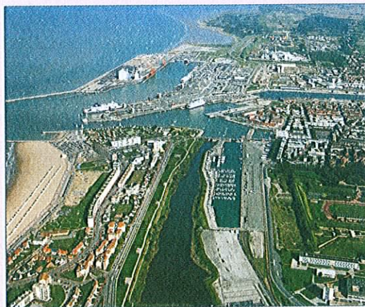
Le port de Calais